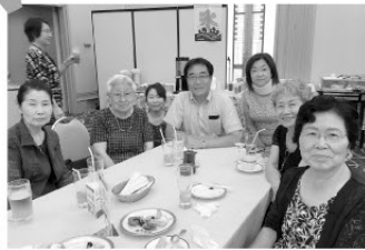
いつも私の傍にいて、厳しく・優しくご指導 いただきます。私の力の源です!