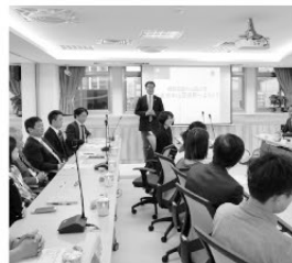
日台友好促進協議の事務局長として、非公式訪問も重ね個人的人脈構築、今回区長の公式訪問を実現し、来期具体的友好関係構築につなげる。