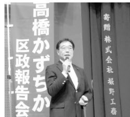
連日の深夜作業のうえに書き上げた区政報告資料を発表。地域の方々のご意見ご要望で更にレベルがあがります!