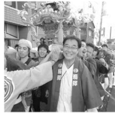
地域が一つになる祭礼行事、 中野の素晴らしい文化です!