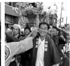
地域が一つになる祭礼行事、 中野の素晴らしい文化です!