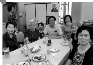
いつも私の傍にいて、厳しく・優しくご指導 いただきます。私の力の源です!