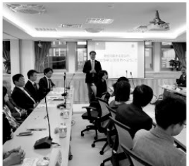
日台友好促進協議の事務局長として、 非公式訪問も重ね個人的人脈構築、 今回区長の公式訪問を実現し、 来期具体的友好関係確結につなげる。