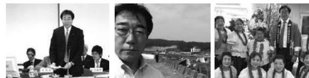
予算特別委員会での総括質疑、納得いくまで質疑! 被災地訪問~防災士として、危機管理士として 江古田地区まつり芸能祭実行委員長