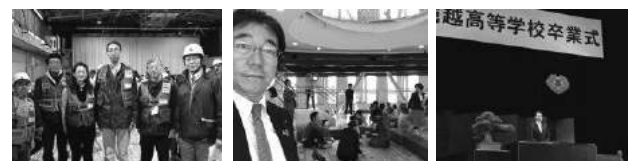
中野区災害医療訓練 子ども、子育て施策は最重要課題 次世代を担う高校生にエール